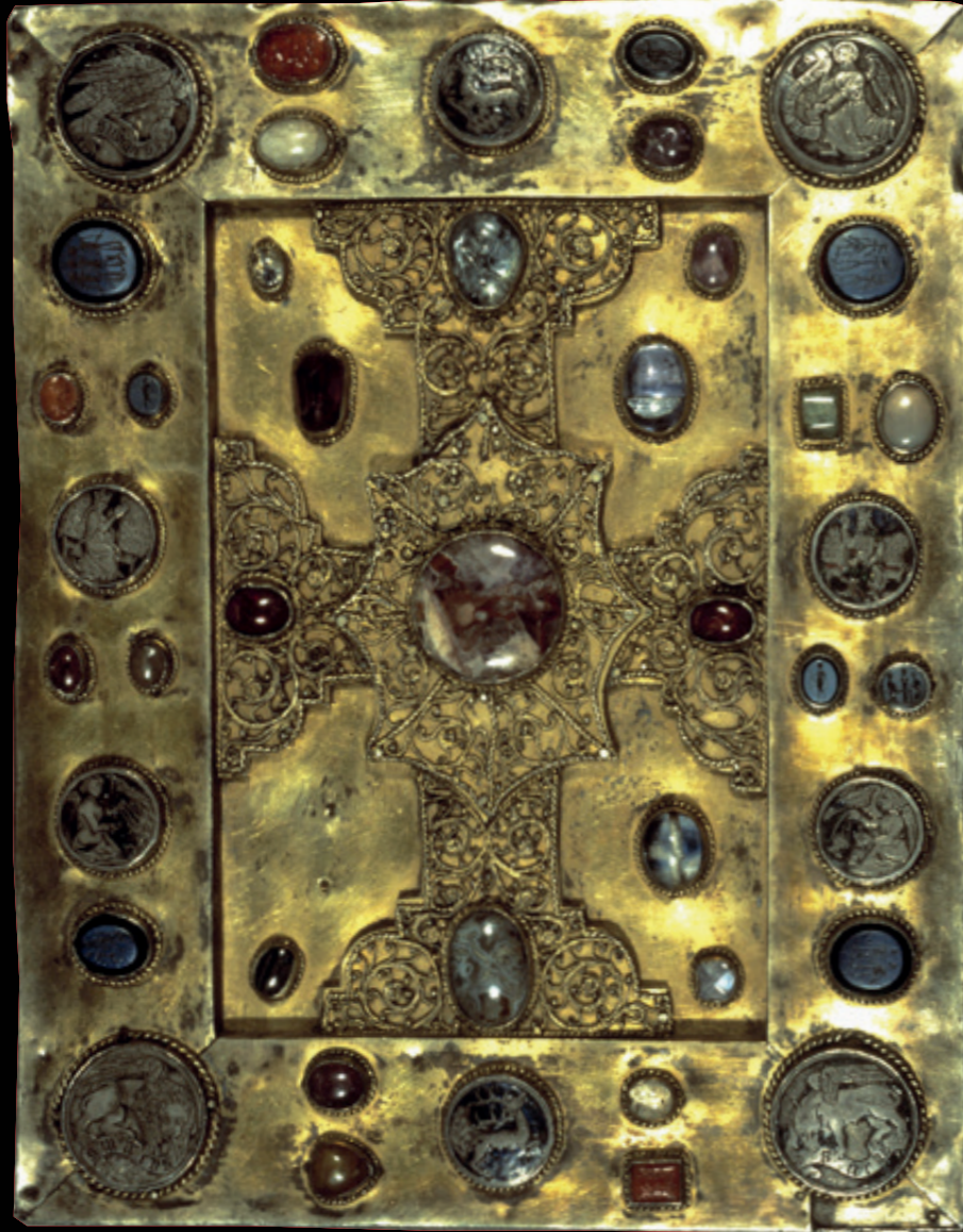
Ansfriiduscodex, boekband, St Gallen, ca. 950-1000, collectie Museum Catharijneconvent (ABM m00902-01)