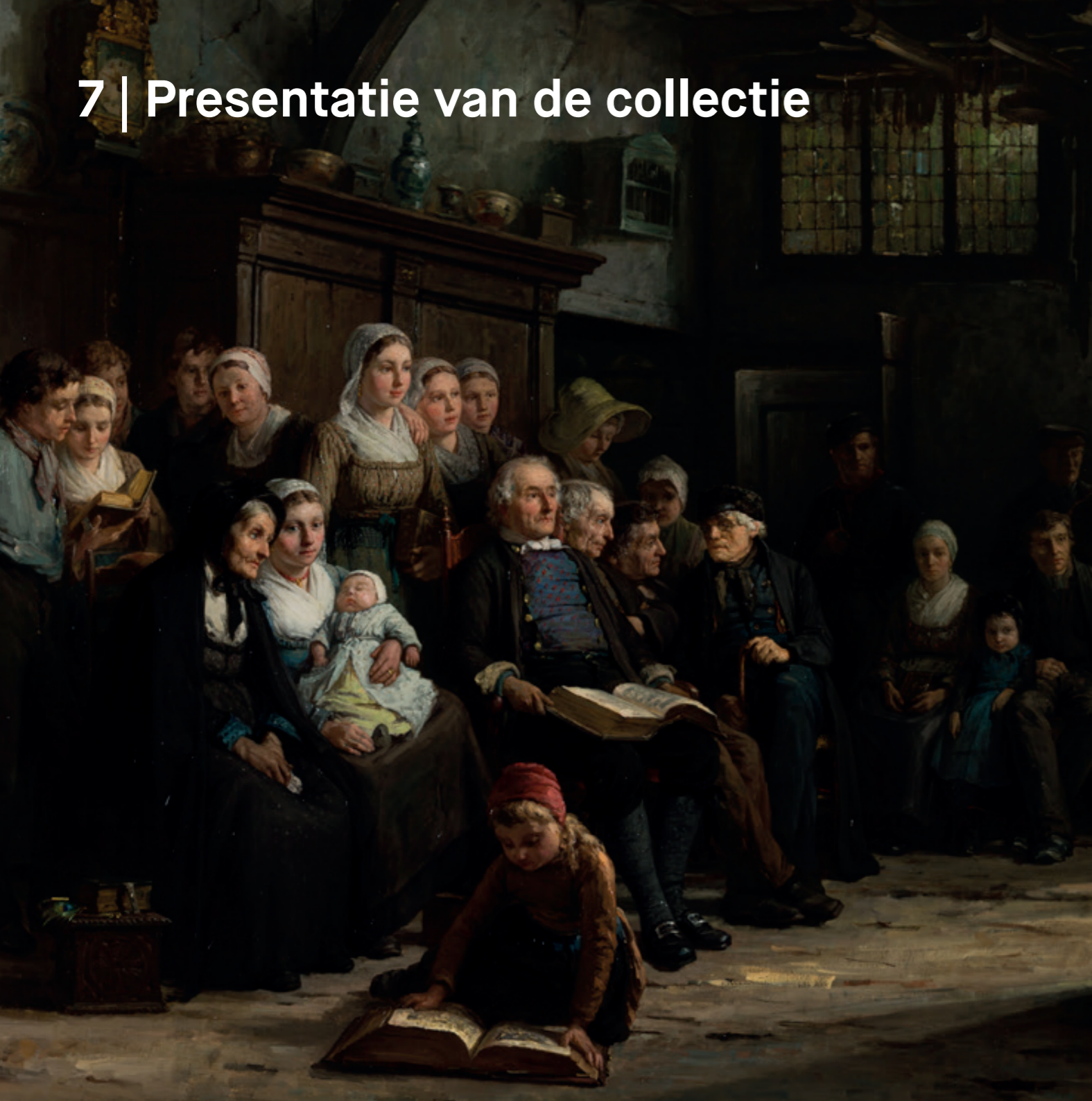
Stichtelijk uurtje in de Achterhoek, Hendrik Valkenburg, 1883, collectie Museum Catharijneconvent (RMCC s370)

De collectie van het museum wordt binnen de muren gepresenteerd in een vaste presentatie en in tentoonstellingen. De eigen collectie is altijd het uitgangspunt, zowel bij de vaststelling van de onderwerpen die het museum agendeert, als bij de selectie van de getoonde objecten. Kunst- en cultuurhistorische topstukken zijn zoveel mogelijk permanent te zien; stukken uit het depot rouleren zoveel mogelijk dankzij de wisselende programmering. Bij presentaties wordt de eigen collectie, naargelang het onderwerp, aangevuld met externe bruiklenen. Daardoor kunnen eigen objecten steeds weer in een nieuwe context worden geplaatst, waardoor de eigen collectie wordt verrijkt en verder wordt ingebed in de Collectie Nederland.