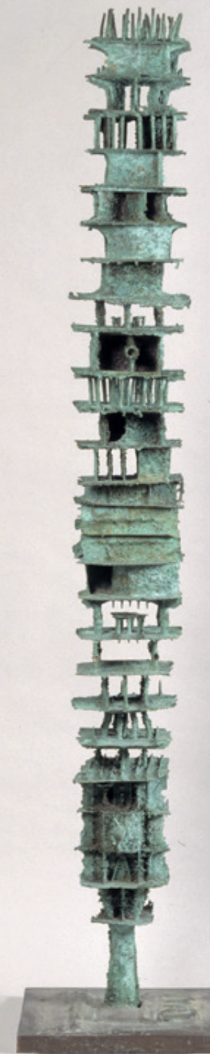
Toren van Babel Shinkichi Tajiri, collectie Museum Catharijneconvent (ABM m1942), 1964

Bovendien wordt een adviescommissie ingesteld die bestaat uit ervaringsdeskundigen, wetenschappers en erfgoed specialisten. De samenstelling van deze commissie is een afspiegeling van de meerstemmigheid van het christendom in Nederland. Deze commissie adviseert ook over de formulering van de selectiecriteria die onderdeel worden van dit collectiebeleid.