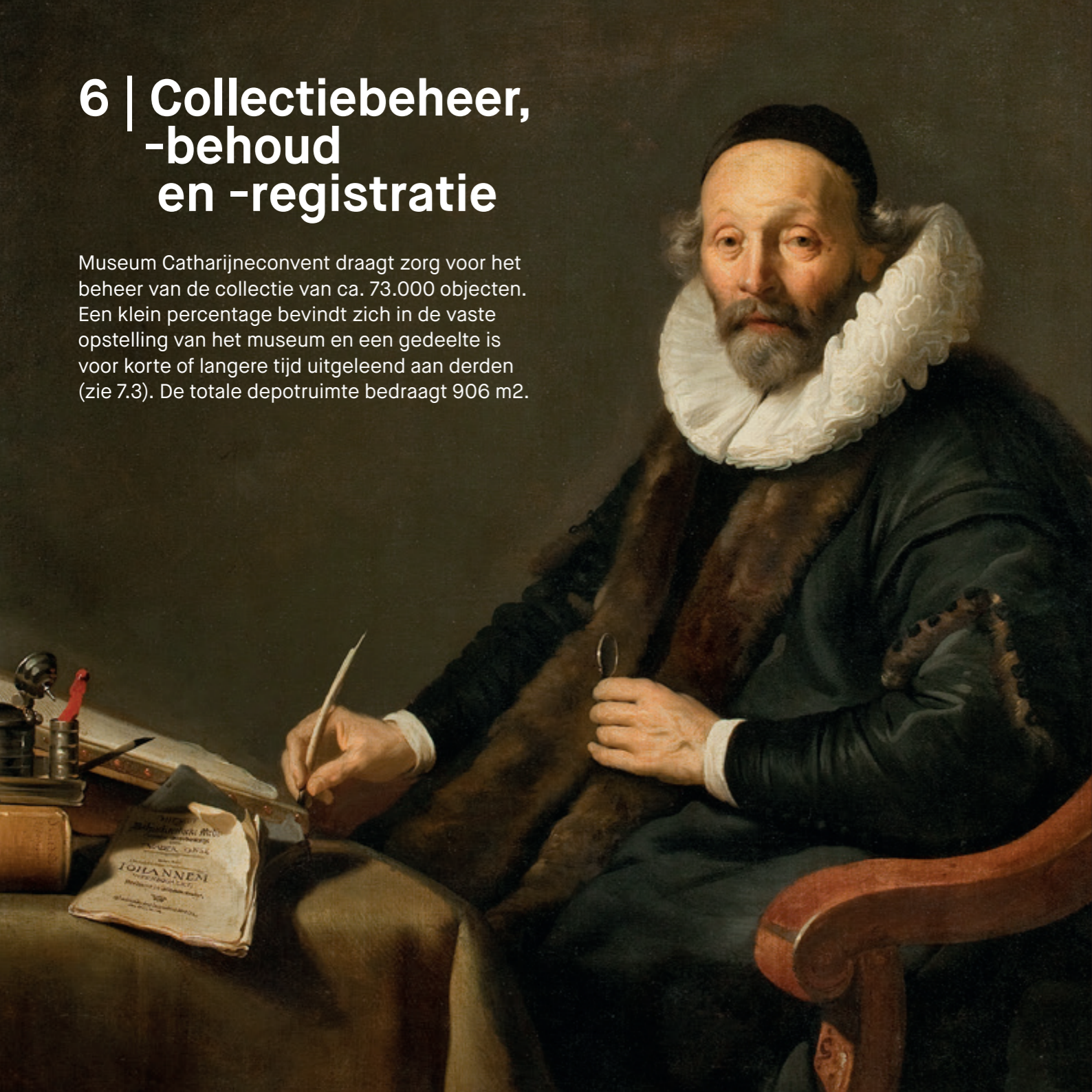
Portret van Johannes Wtenbogaert, Jacob Backer, 1638, collectie Museum Catharijneconvent (RMCC s347)

Museum Catharijneconvent draagt zorg voor het beheer van de collectie van ca. 73.000 objecten. Een klein percentage bevindt zich in de vaste opstelling van het museum en een gedeelte is voor korte of langere tijd uitgeleend aan derden (zie 7.3). De totale depotruimte bedraagt 906 m 2 .