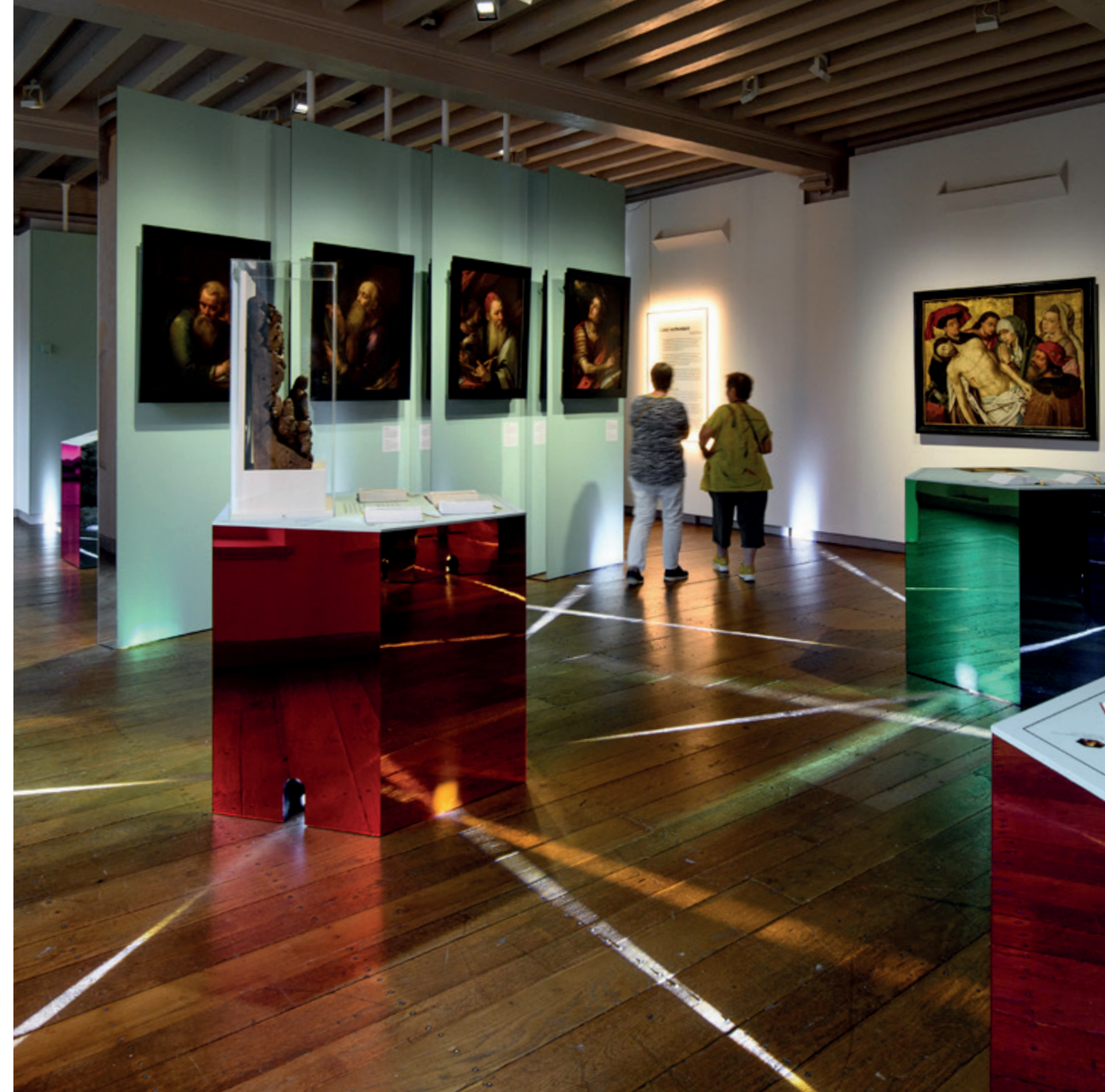
Tentoonstelling Maria Magdalena

Collectievorming, onderzoek en programmering vormen een cirkel, waarvan de verschillende onderdelen elkaar aanvullen en versterken (zie hoofdstuk 3). De collectiethema's zorgen voor meer inhoudelijke samenhang binnen de collectie en ook voor een meer integrale benadering van collectievorming, onderzoek en programmering. De collectiethema's hebben een lange geldigheid en zorgen voor continuïteit bij het verzamelen, voor maatschappelijk relevantie en voor gerichte kennisvermeerdering. Daarmee waarborgt het museum dat de collectie een rijke bron blijft voor zijn tentoonstellingen en andere publieksactiviteiten.