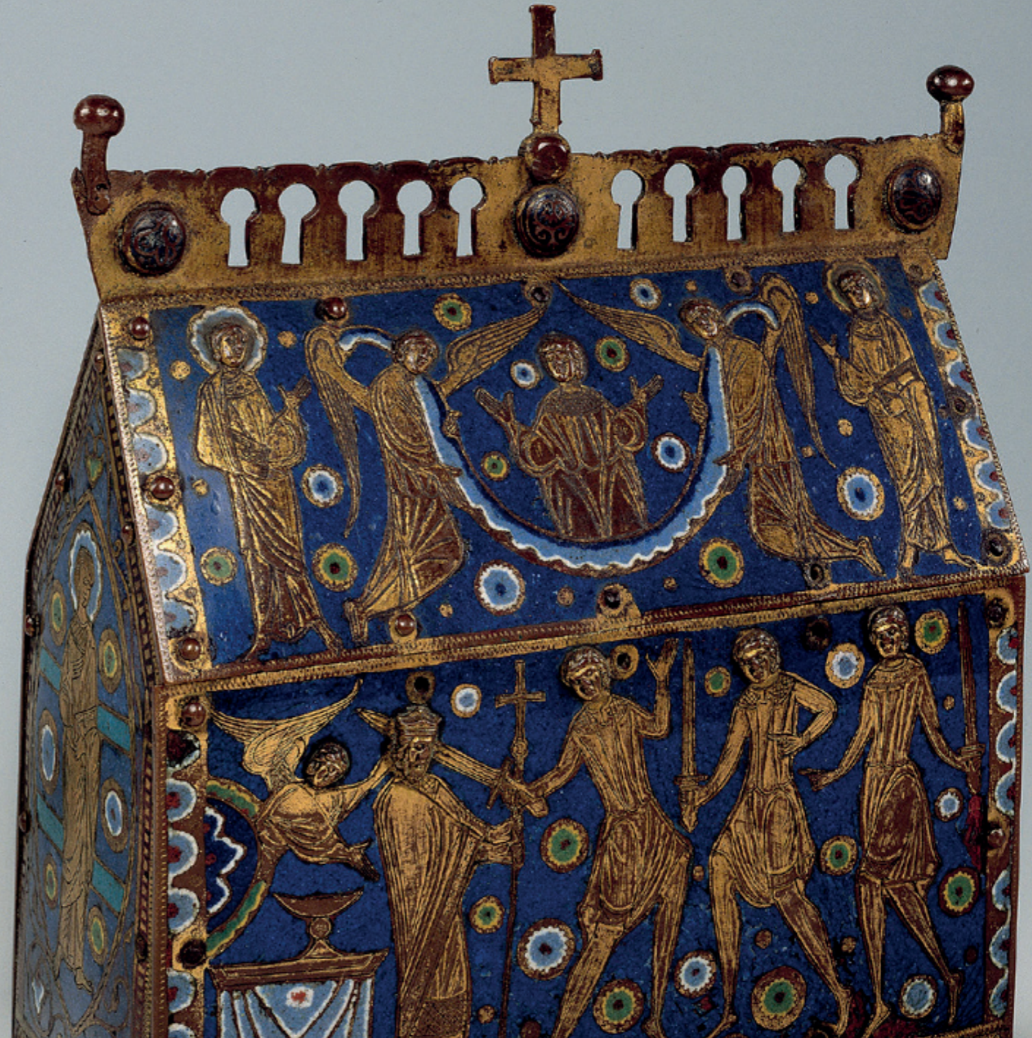
Reliekschrijn van Thomas Becket, Frankrijk, circa 1200, collectie Museum Catharijneconvent (ABM m907)

Voor een uitgebreide beschrijving van het onderzoek naar de collectie en de publicaties, door eigen en externe specialisten, zie het Kennisplan 2021-2024 , dat in 2021 wordt opgesteld.