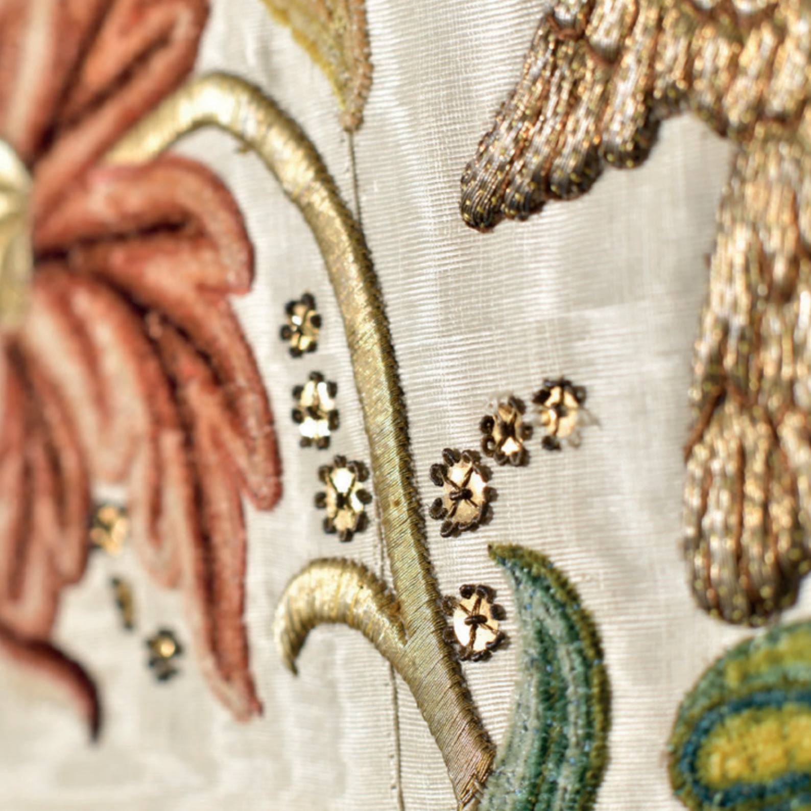
Detail van geborduurde bloemrank en vleugel van pelikaan op een wit kazuifel, Noord-Nederland, Amsterdam, circa 1750, collectie Museum Catharijneconvent (BMH t128a)

Ter versterking van de representativiteit van deze kerncollectie is het museum alert op de verwerving van een laatmiddeleeuws altaarretabel of huisretabel waarvan ook de geschilderde zijpanelen nog aanwezig zijn.