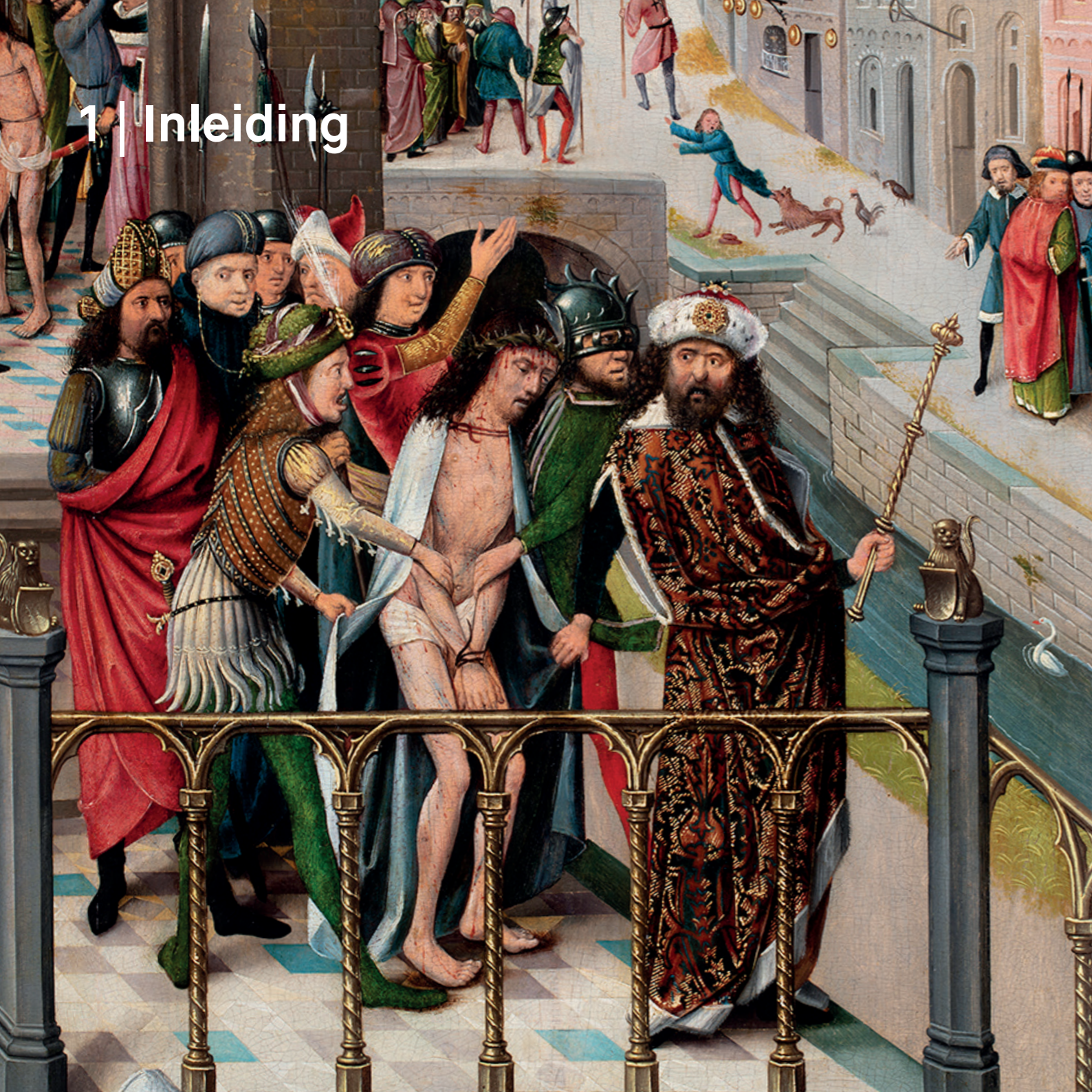
Detail Ecce Homo, taferelen uit het lijden van Christus, Rijnland, circa 1490-1500, collectie Museum Catharijneconvent (RMCC s375)