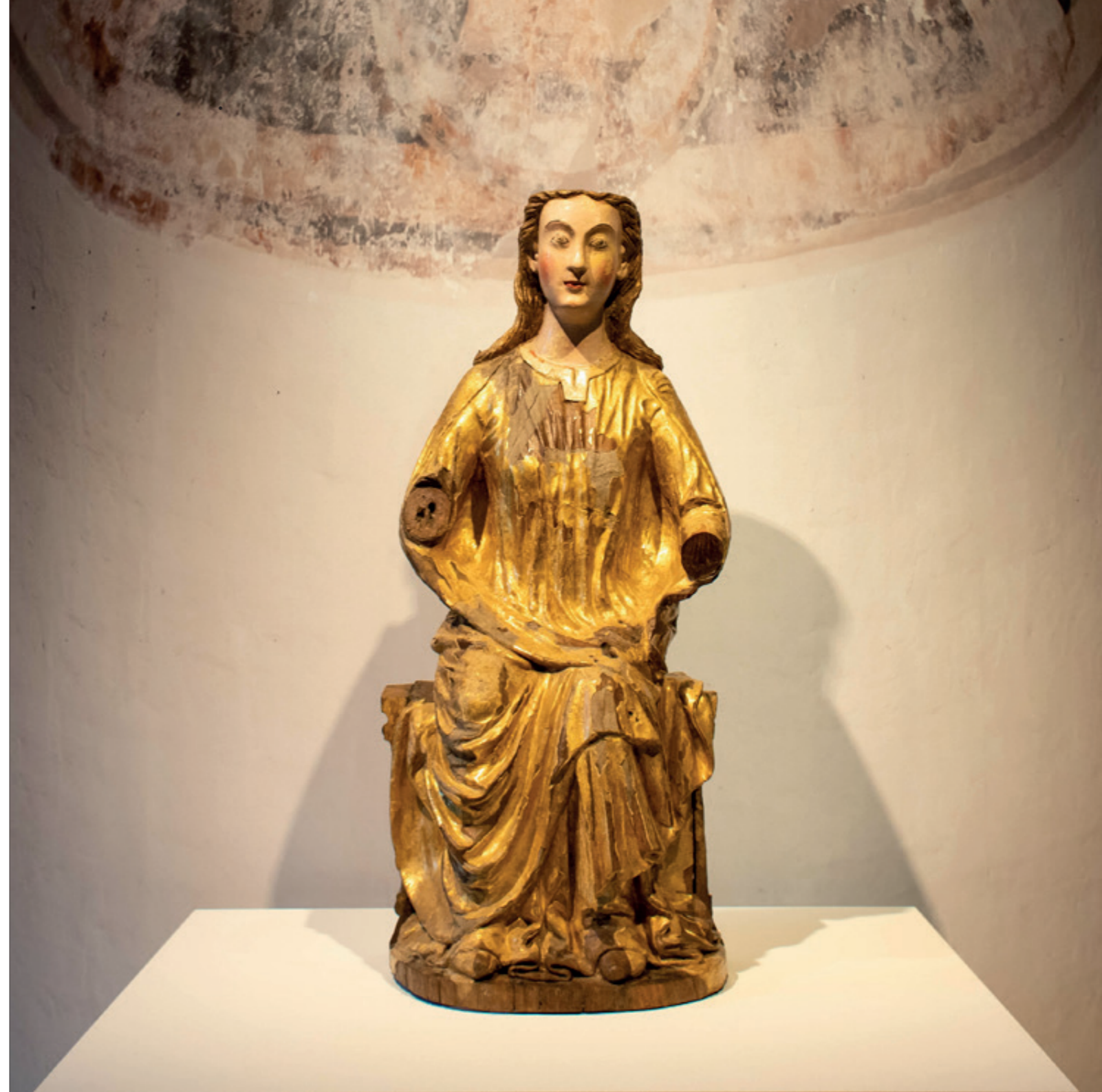
Zittende Maria, Maasgebied, ca. 1240. Utrecht, collectie Museum Catharijneconvent (ABM bh316)