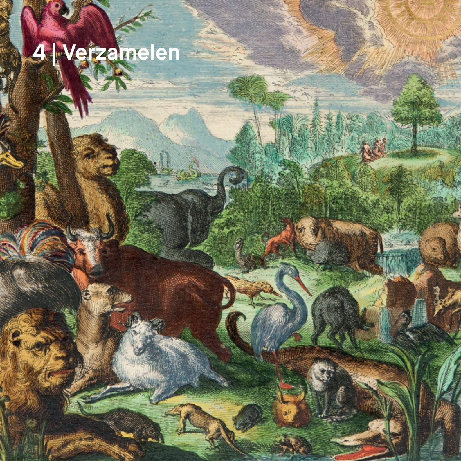
Detail van Statenbijbel, Oude Testament, met bijgebonden 't Groot Waereids Tafereel, Romeyn de Hooghe, 1715, collectie Museum Catharijneconvent (RMCC od341a) | Foto Ruben de Heer.

Volgens de ethische code voor musea van het ICOM moet een museum duidelijk omschrijven welke betekenis de collectie heeft als primaire kennisbron. Het verzamelbeleid mag niet worden gedomineerd door trends. Het museum onderscheidt daarom twee hoofdredenen voor het opnemen van voorwerpen in de collectie: