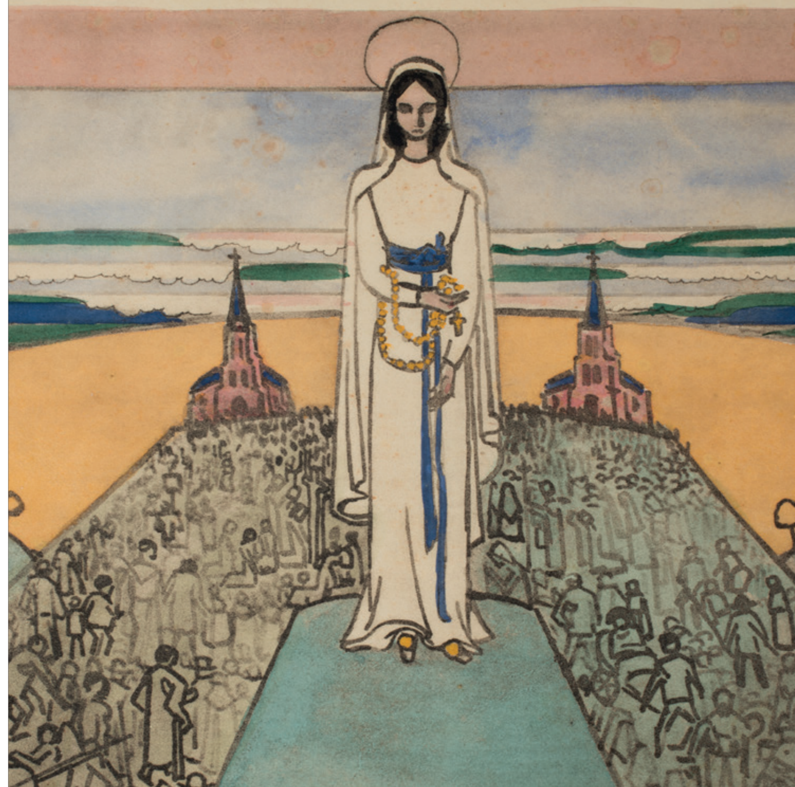
Onze-Lieve-Vrouw van Lourdes, Jan Toorop, 1910, collectie Museum Catharijneconvent (ABM g717-1)

Het museum bezit ongeveer 300 objecten van pijpenpaarde, waaronder een zeldzame mal van de voorzijde van een beeldje van Franciscus in monnikspij met stigmata (1475-1500, RMCC b102a)