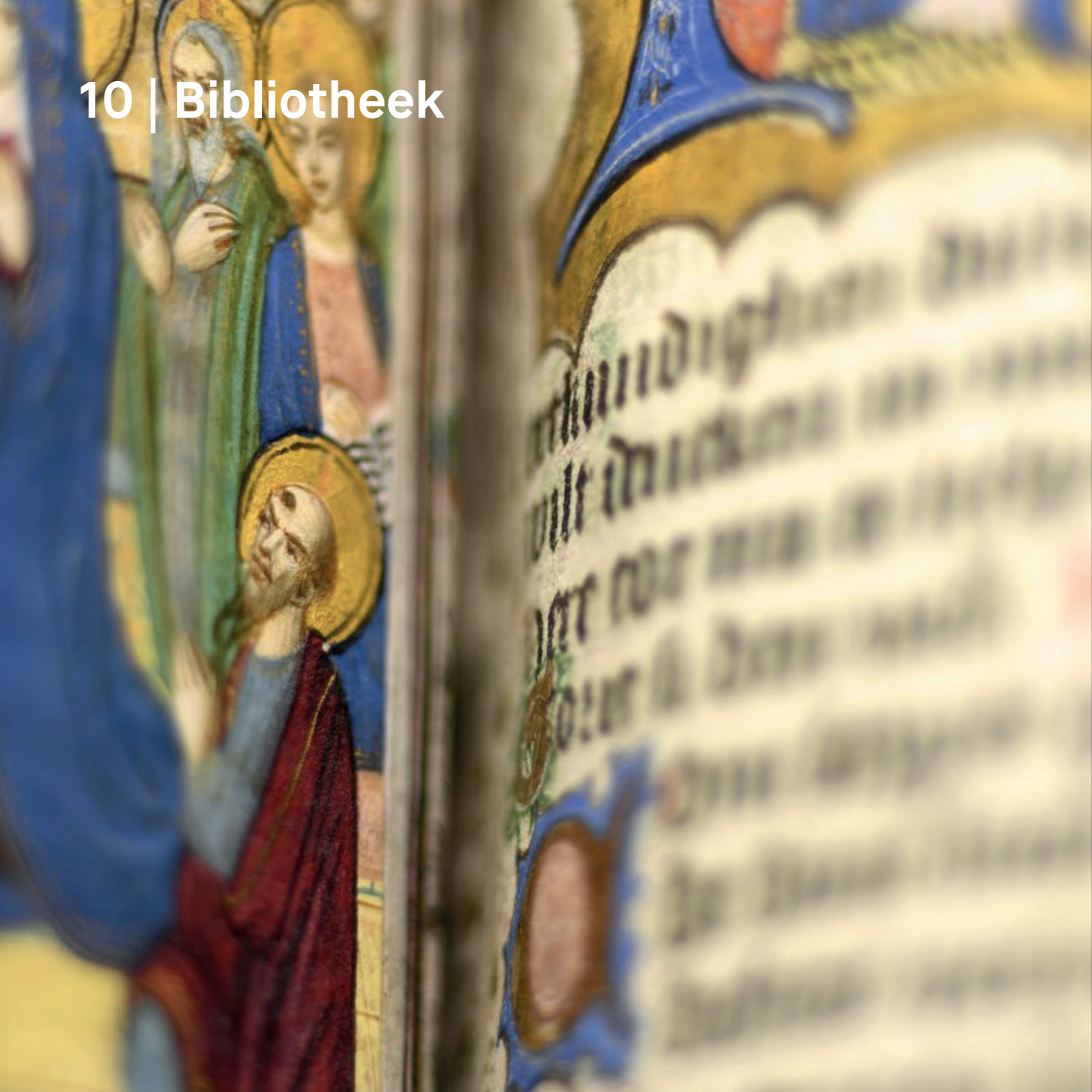
Getijdenboek, Brugge, Geert Grote, ca. 1480, collectie Museum Catharijneconven (OKM h1)