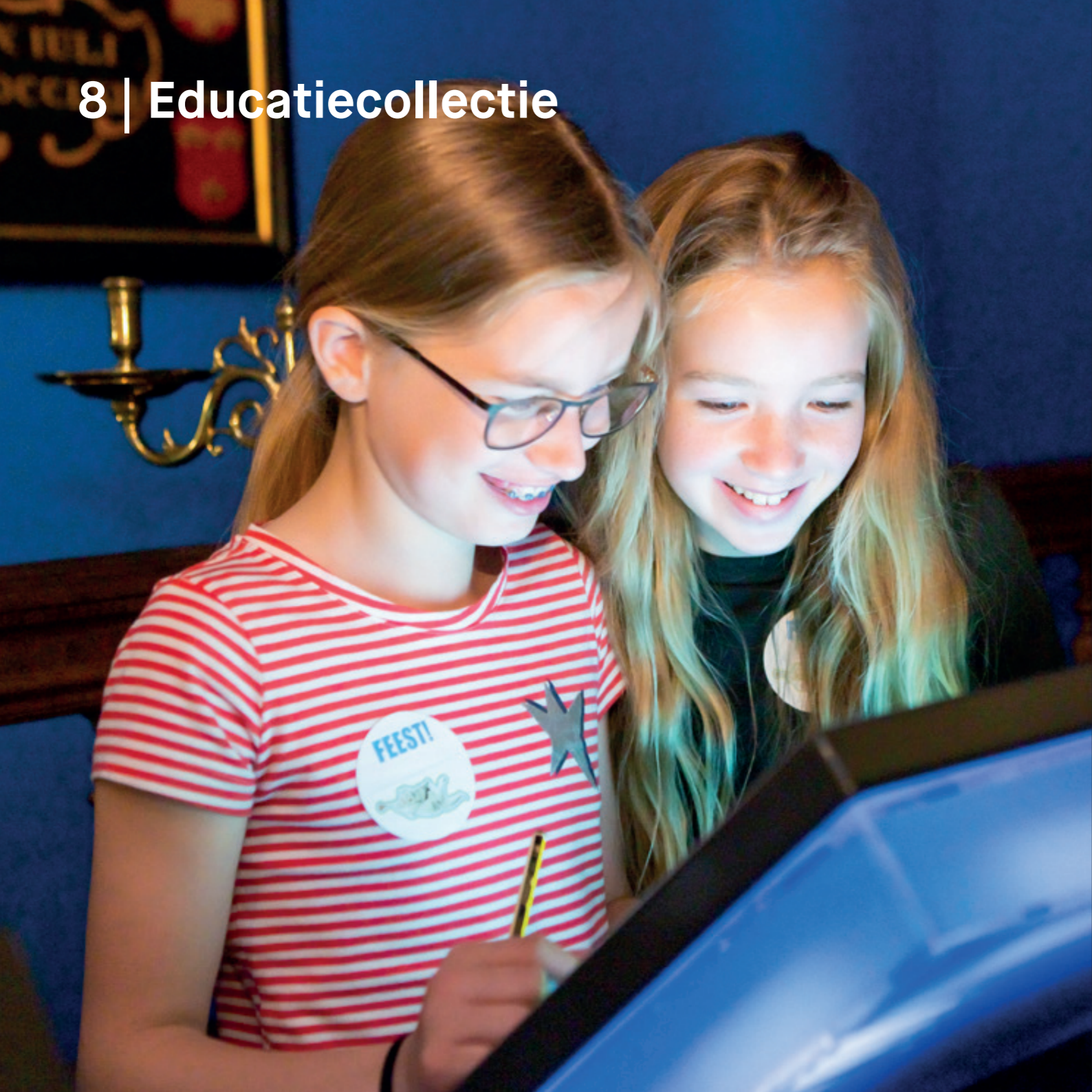
Feest! in Museum Catharijneconvent

De afdeling Educatie en Publiek beheert een educatiecollectie die kan worden ingezet voor publieksbegeleiding. Het zijn voorwerpen die niet tot de museumcollectie behoren en die mogen worden aangeraakt. Educatie en participatie zijn van groot belang voor het museum, omdat ze een brug bouwen tussen collectie en publiek. In deze beleidsperiode werkt het museum voor de publieksgroepen tentoonstellingsbezoekers, onderwijs, families en nieuwkomers. Voor elk van deze groepen worden specifieke vormen van publieksbegeleiding ontwikkeld