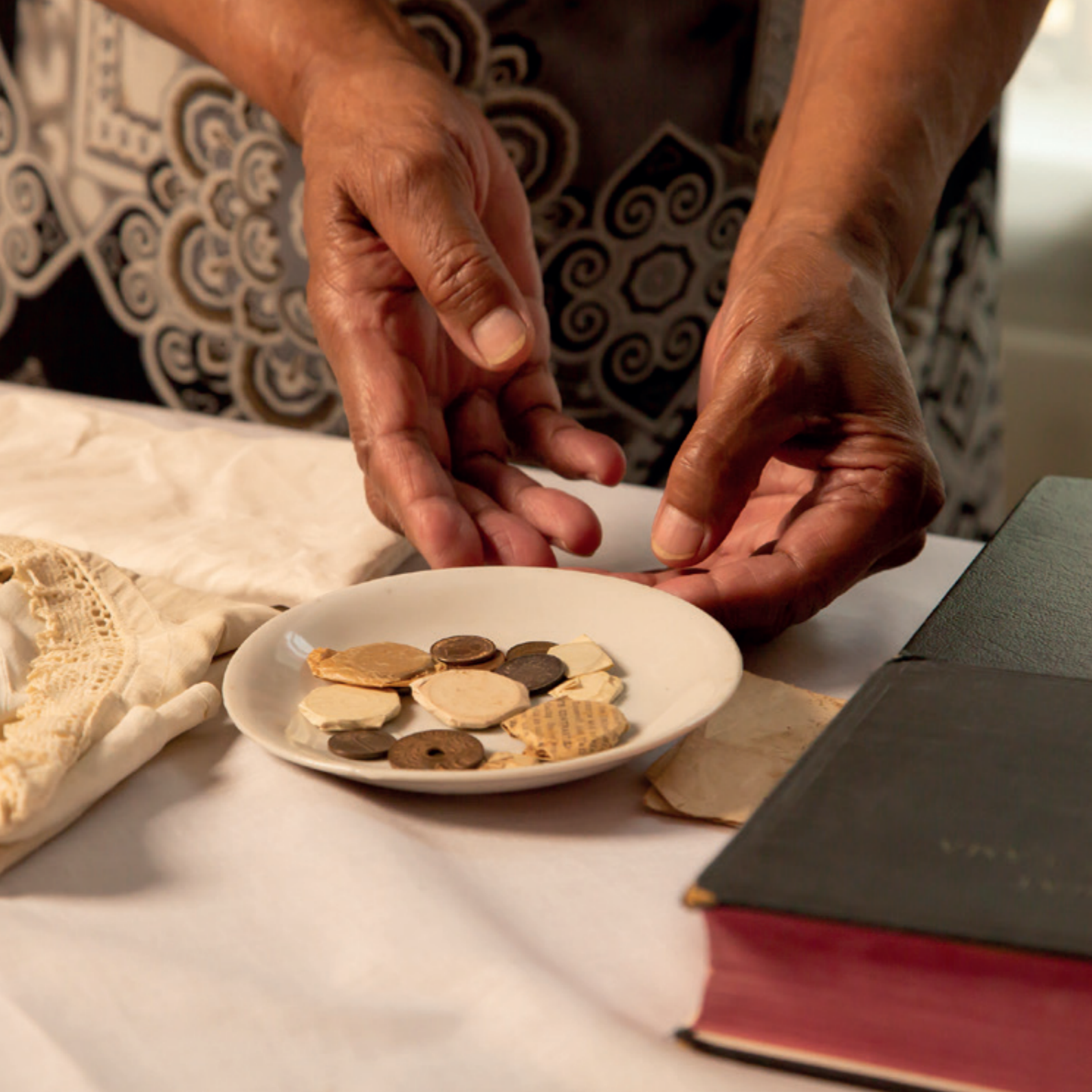
Piring natzar in focuspresentatie Mystiek Moluks . Ontmoet de piring natzar, langdurige bruikleen Molukse kerk in Apeldoorn